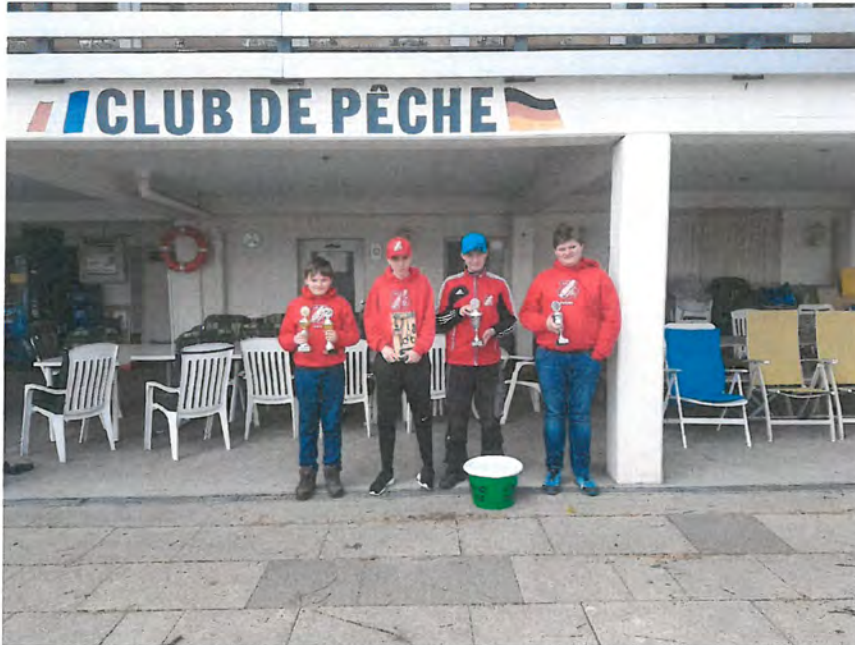
Abb. Jugendgruppe mit Ehrengaben beim Ausrichter Club De Peche

Somit konnten wir uns schon im Frühjahr 2017, mit unseren „Jungstippnern“ im „Mix-Team“ [2x Senioren /2x Jugendlicher] und bei den Verbands-Jugend-Hegefischen erfolgreich Platzzieren.