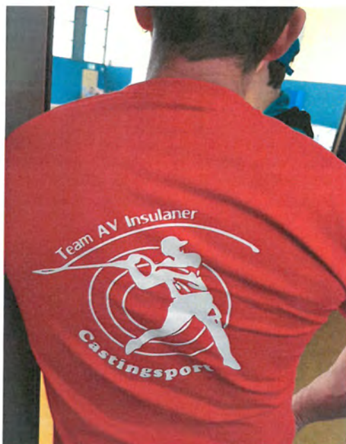
Abb. Teamkleidung „AV.Insulaner“

Der Casting-Sport begleitete uns die gesamte Saison, demnach nahmen wir auch regelmäßig mit unserer Jugend am „Casting-Hallentraining“ in Reinickendorf teil. Zur Identifikation hat sich auch unsere „rot-weiße“ Vereinskleidung dem „Casting“ angepasst und wird mit Stolz getragen.