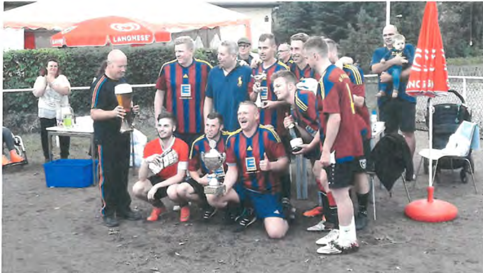
Abb. Turniersieg als Team „Hauptstadtangler“ beim LOK-Schöneweide BWB-Turnier.

Zum Abschluss des Jahres erlebten wir am 02. Dezember 2017 unsere traditionelle Weihnachtsfeier, woran fast alle Jugendliche mit Ihren Eltern teilnahmen.