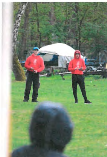
Abb. Siegerehrung für unsere Besten „Werfer“ beim Casting