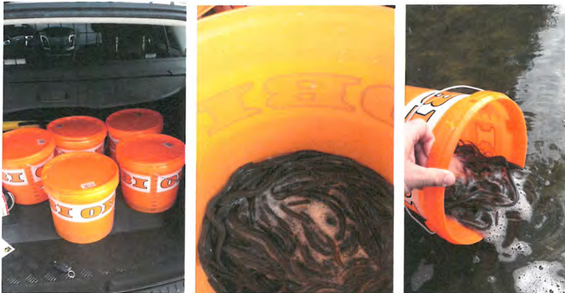
Abb. „Aalbesatz 2017“

Im Frühjahr 2017 wurden uns „Jung-Aale“ vom Fischereiamt bereitgestellt und durch unsere Jugendlichen in verschiedenen Abschnitten des „Alten – Spandauer-Schiffahrtskanal“ und unserem Rohrbruchteich besetzt.