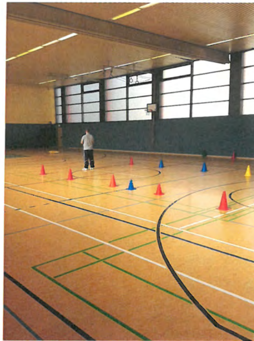
Abb. Verbands-Castingveranstaltung / Hallentraining 2017

Der Casting-Sport begleitete uns die gesamte Saison, demnach nahmen wir auch regelmäßig mit unserer Jugend am „Casting-Hallentraining“ in Reinickendorf teil. Zur Identifikation hat sich auch unsere „rot-weiße“ Vereinskleidung dem „Casting“ angepasst und wird mit Stolz getragen.