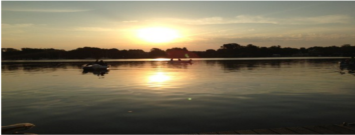
Der Blick vom Steg, vor dem Ersten Angeln des Jahres

Ganz nach dem Motto "eine Hand wäscht die Andere", hieß es dann für unsere Jugend erstmal Booteslippen und dem einen oder anderen Sportskameraden beim Motoreinhängen helfen.